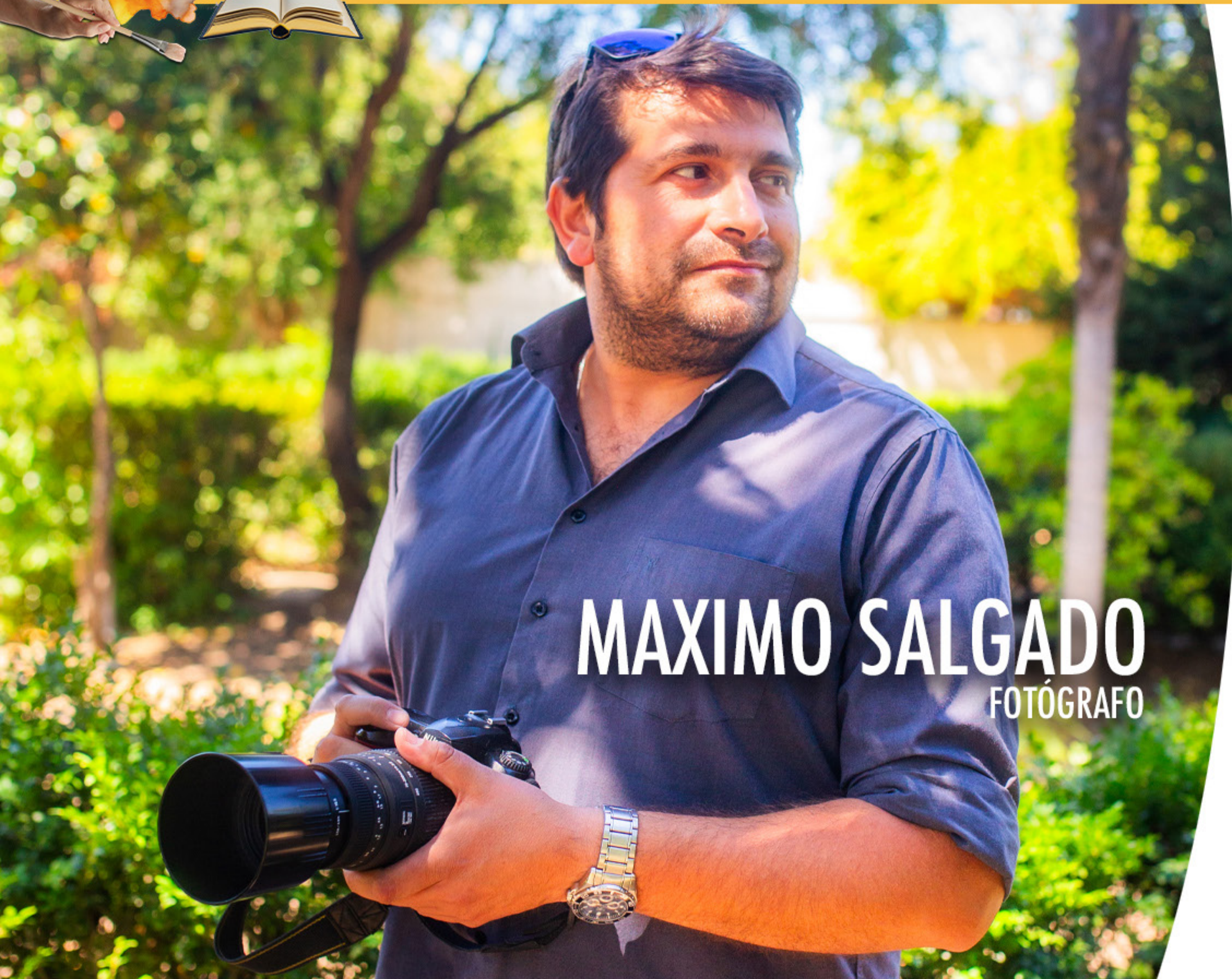
MAXIMO SALGADO FOTÓGRAFO

Fotografía Digital, de Paisajes, Deportes y Documentalista